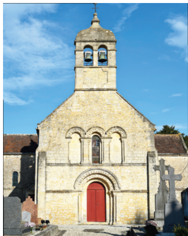
Église Saint-Jacques de Cresserons

Charmants villages préservés aux portes de la mer