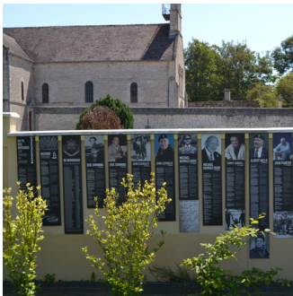
Portraits de vétérans | Photo : C. Hudson

Monument à la mémoire des soldats britanniques du 22nd Dragoon Régiment de la 30th Armoured Brigade, morts pour la libération de Cresserons en juin 1944. En début de matinée, le 6 juin 1944, la commune est sous le contrôle des soldats Anglais du 1st South Lancashire Régiment appartenant à la 8 ème brigade d'infanterie, appuyés par les cavaliers du 22nd Dragoon. La localité n'est totalement libérée que le 7 juin 1944. Le square est dédié à Ian Hammerton, à la tête du régiment des 22nd Dragoon. Une exposition permanente des portraits de vétérans est apposée contre le mur du fond du square.