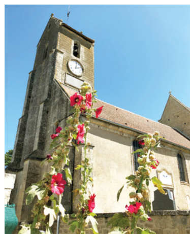
Église Saint-Samson de Plumetot