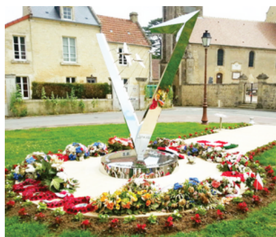
Mémorial Polonais

Maison dont la charpente fut réalisée par un charpentier de marine. D'où la toiture en forme de coque de bateau renversé !