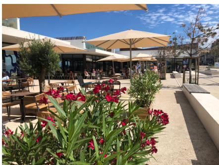
Place du Petit-Enfer

Luc-sur-Mer fit partie des paroisses obligées de constituer un cimetière protestant. Il fut établi à mi-chemin du village et du bord de mer. Après la révocation de l'Édit de Nantes, ce lieu où les hérétiques étaient inhumés fut surnommé le « Petit Enfer » (il portait déjà le nom d'« Enfer » parce que les pestiférés décédés lors des épidémies y avaient déjà été enterrés).