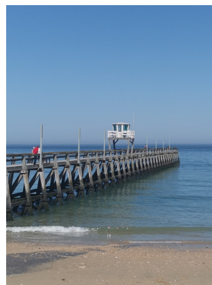
Jetée des pêcheurs