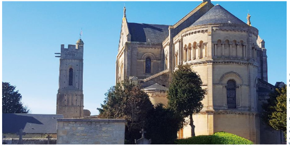
Eglise Saint-Quentin