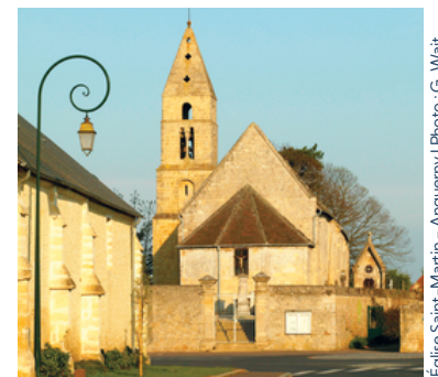
Église Saint-Martin - Anguerny | Photo : G. Wait

Sur les toits : des rampants dits « à pas de chats » ou à « pas de moineaux ». Ces rampants des murs pignon sont dits « à redents » et dessinent des petites marches. Il ne s'agit là que d'un élément esthétique d'architecture.