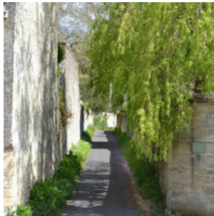
Rue de Coursanne - Chemin de la trappe

20 Maison et atelier Poulbot I n°14 – privé Ancienne maison et atelier de l'artiste parisien Poulbot. Illustrateur et affichiste célèbre grâce à ses dessins de la vie de ces gosses de Montmartre : les Poulbots. Cette marmaille joyeuse des quartiers pauvres de Paris pour lesquels il ne cessera de se battre en leur offrant une légitimité à travers ses dessins. Il achète cette propriété, qu'il nomme « le petit château » en 1920 pour en faire une résidence de vacances. Il y séjourne avec ses proches dès l'occupation. Puis il repartira avec sa famille à Montmartre et vendra cette propriété en 1943.