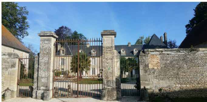
Manoir de Colomby | Photo : C. Hudson

16 Manoir de Colomby I privé Joli manoir du XVIII e siècle. De style classique composé d'un corps central surmonté d'un fronton triangulaire et encadré par deux avant corps asymétriques. La décoration épurée souligne de très jolies lucarnes en pierre. Il fut pendant l'occupation allemande, le siège d'une Kommandantur. Les Allemands l'avaient converti en petite forteresse entourée d'un système de tranchées, contrôlant la route de Thaon. Aujourd'hui, à travers les grilles on peut distinguer un très joli puits (copie de celui du château de Fontaine-Henry de style renaissance). L'original se trouve dans le jardin de l'annexe face au manoir.