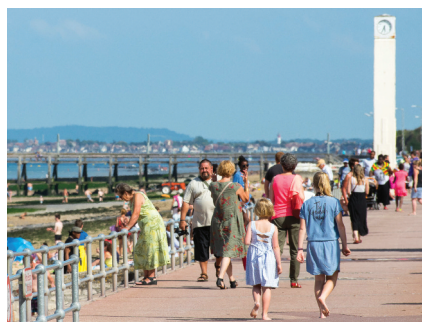
Petit Enfer

Luc-sur-Mer fit partie des paroisses obligées de constituer un cimetière protestant. Il fut établi à mi-chemin du village et du bord de mer. Après la révocation de l'Édit de Nantes, ce lieu où les hérétiques étaient inhumés fut surnommé le « Petit Enfer » (il portait déjà le nom d'« Enfer » parce que les pestiférés décédés lors des épidémies y avaient déjà été enterrés).