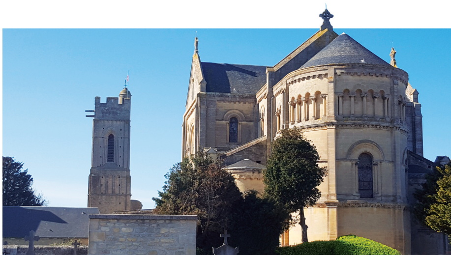
Église Saint-Quentin