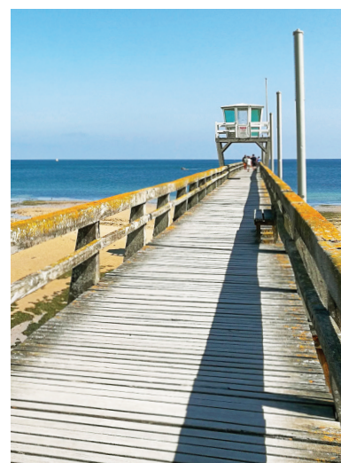
Jetée des pêcheurs